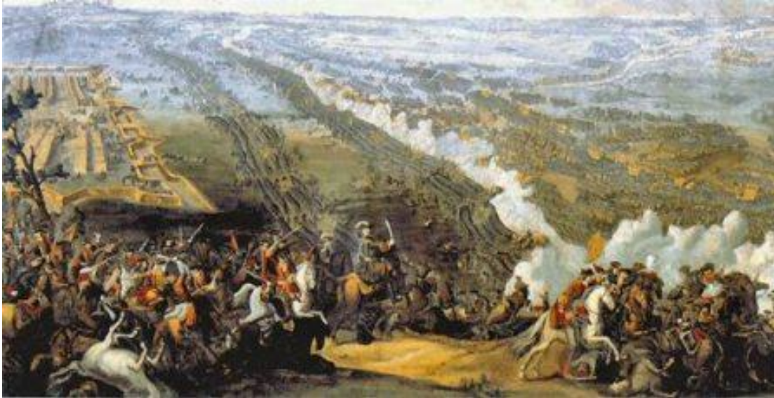
Slaget vid Poltava 1709. Efter en målning av Denis Martens d.y. 1726.